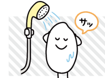
お米はサッと洗う